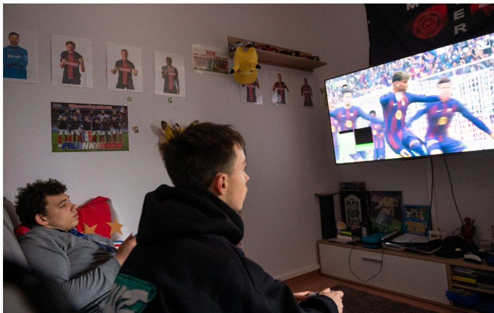
Auch auf der PlayStation geht es meist um das Lieblingsthema Fußball.