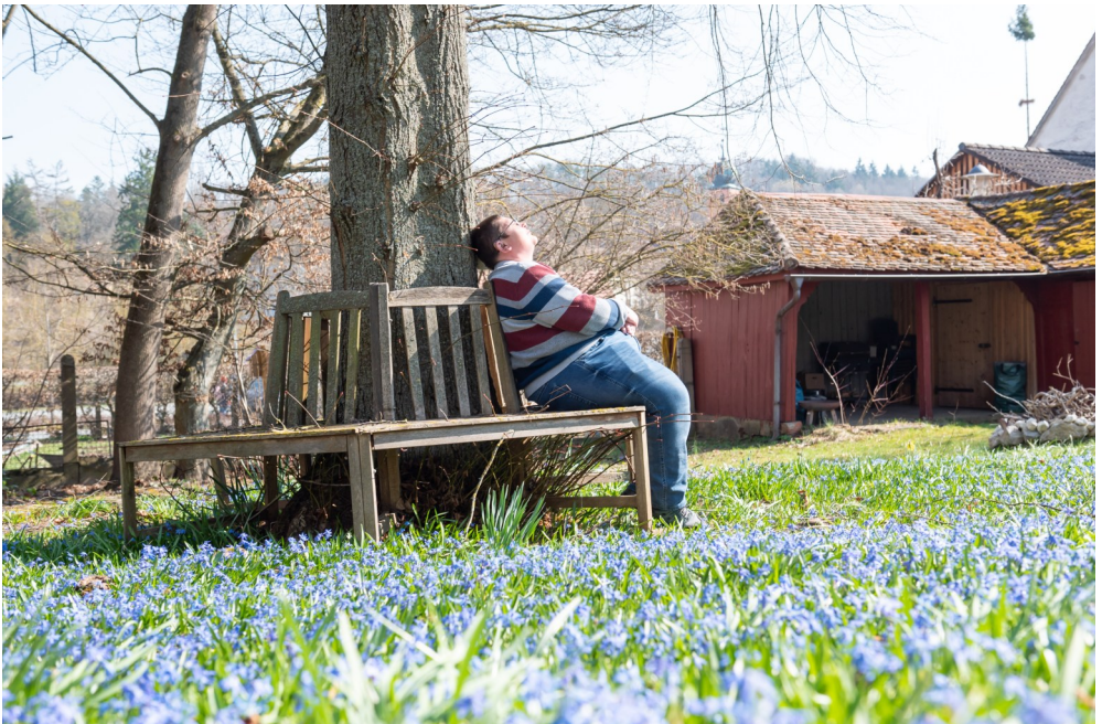
Die Sonne scheint und die ersten Blumen blühen: Auch im Garten im Zochaweg lässt es sich gut aushalten.

Im Winter male ich sehr gerne in meinem Zimmer, im Garten gibt es da ja leider nicht so viel zu tun. Im Sommer entspannt mich das Gärtnern einfach am meisten und macht mich sehr glücklich. Ich bin auch richtig stolz auf meinen eigenen Garten.